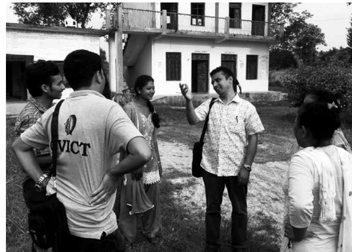
CVICT:n ja terveysaseman työntekijöitä Ghadawan terveysaseman edessä.

toteutumisesta, jotta toimintaa voidaan vielä kesken hankkeen tehostaa. Ulkopuolisen silmät huomaavat mahdolliset puutteet paremmin, sillä varsinaisessa toiminnassa mukana olevilta tietyt sokeat pisteet saattavat jäädä huomaamatta. Sisäinen arviointi auttaa myös yhtenäistämään LSV:n kehy-hankkeita ja tuomaan yhdessä hankkeessa opittua muiden hankkeiden käyttöön.