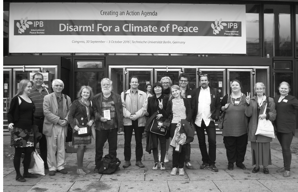
Konferenssin teema oli 'Disarm - For a Climate of Peace'. Kuvassa suomalaisten delegaatio konferenssipaikan, Berliinin teknillisen yliopiston, edustalla.